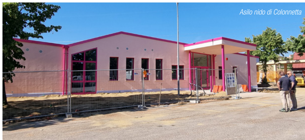
Asilo nido di Colonna