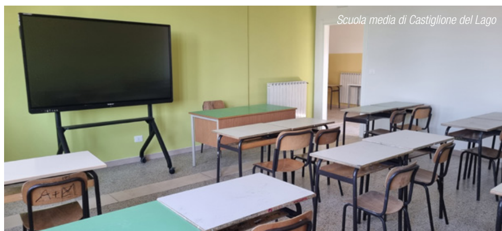
Scuola media di Castiglione del Lago

Pino Bistacchi, assessore a lavori pubblici, patrimonio, protezione civile, agricoltura, sicurezza, polizia locale